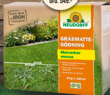
Gräsmattegödning 5 kg. Motverkar mossa och ogräs.