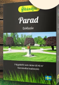
Parad, 1 kg. Gräsmattefrö. Exklusiv och tät.

Förvandla din trädgård till en frodig oas med vårt högkvalitativa gräsfrö från Skånefrö. Svenska fröer från Österlen med en lång historia av kvalitet och hållbarhet. Noga utvalt för att vara mångsidigt och klara av olika förhållanden, vilket gör det lika användbart i Norrland som i Skåne.