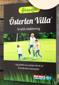
Österlen Villa, 1 kg. Gräsmattefrö. Snabb etablering.