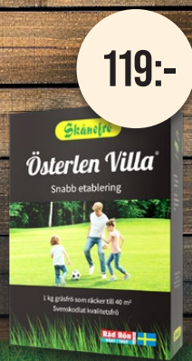
Österlen Villa, 1 kg. Gräsmattefrö. Snabb etablering.