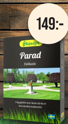
Parad, 1 kg. Gräsmattefrö. Exklusiv och tät.

Förvandla din trädgård till en frodig oas med vårt högkvalitativa gräsfrö från Skånefrö. Svenska fröer från Österlen med en lång historia av kvalitet och hållbarhet. Noga utvalt för att vara mångsidigt och klara av olika förhållanden, vilket gör det lika användbart i Norrland som i Skåne.