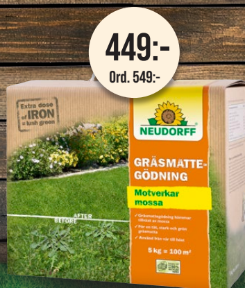
Gräsmattegödning 5 kg. Motverkar mossa och ogräs.