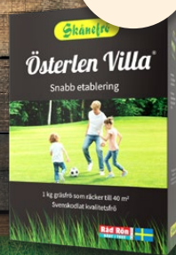
119:- Österlen Villa, 1 kg. Gräsmattefrö. Snabb etablering.