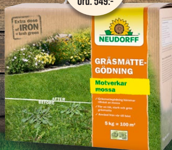
449:- Ord. 549:- Gräsmattegödning 5 kg. Motverkar mossa och ogräs.