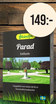
Parad, 1 kg. Gräsmattefrö. Exklusiv och tät.

Förvandla din trädgård till en frodig oas med vårt högkvalitativa gräsfrö från Skånefrö. Svenska fröer från Österlen med en lång historia av kvalitet och hållbarhet. Noga utvalt för att vara mångsidigt och klara av olika förhållanden, vilket gör det lika användbart i Norrland som i Skåne.