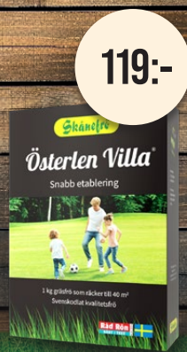
Österlen Villa, 1 kg. Gräsmattefrö. Snabb etablering.