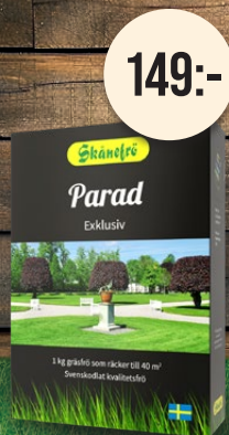
149:- Parad, 1 kg. Gräsmattefrö. Exklusiv och tät.

Förvandla din trädgård till en frodig oas med vårt högkvalitativa gräsfrö från Skånefrö. Svenska fröer från Österlen med en lång historia av kvalitet och hållbarhet. Noga utvalt för att vara mångsidigt och klara av olika förhållanden, vilket gör det lika användbart i Norrland som i Skåne.