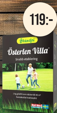
Österlen Villa, 1 kg. Gräsmattefrö. Snabb etablering.