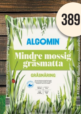
Mindre mossig gräsmatta. Algomin gräsnäring.