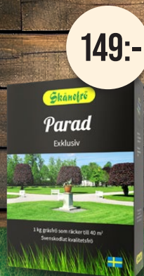
Parad, 1 kg. Gräsmattefrö. Exklusiv och tät.

Förvandla din trädgård till en frodig oas med vårt högkvalitativa gräsfrö från Skånefrö. Svenska fröer från Österlen med en lång historia av kvalitet och hållbarhet. Noga utvalt för att vara mångsidigt och klara av olika förhållanden, vilket gör det lika användbart i Norrland som i Skåne.