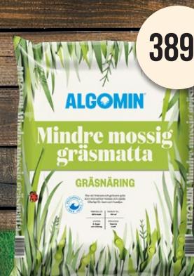
Mindre mossig gräsmatta. Algomin gräsnäring.