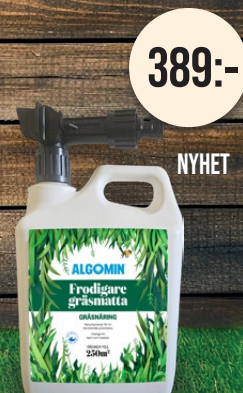
Frodigare gräsmatta Gräsnäringsspruta.