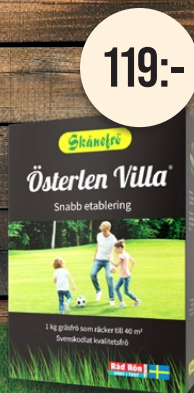
Österlen Villa, 1 kg. Gräsmattefrö. Snabb etablering.