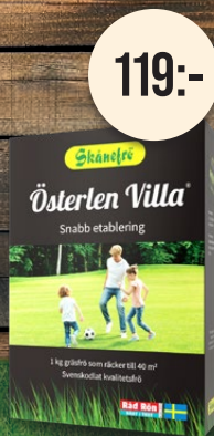
Österlen Villa, 1 kg. Gräsmattefrö. Snabb etablering.