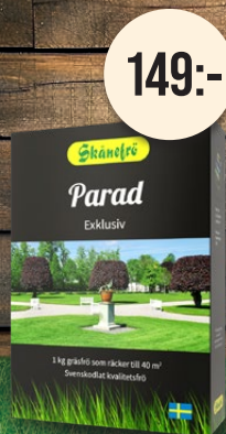
Parad, 1 kg. Gräsmattefrö. Exklusiv och tät.

Förvandla din trädgård till en frodig oas med vårt högkvalitativa gräsfrö från Skånefrö. Svenska fröer från Österlen med en lång historia av kvalitet och hållbarhet. Noga utvalt för att vara mångsidigt och klara av olika förhållanden, vilket gör det lika användbart i Norrland som i Skåne.