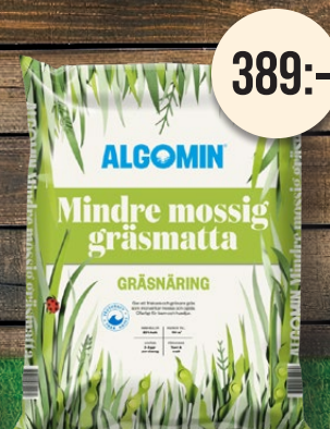
Mindre mossig gräsmatta. Algomin gräsnäring.